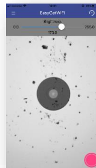
↑ スマートフォンの画面例